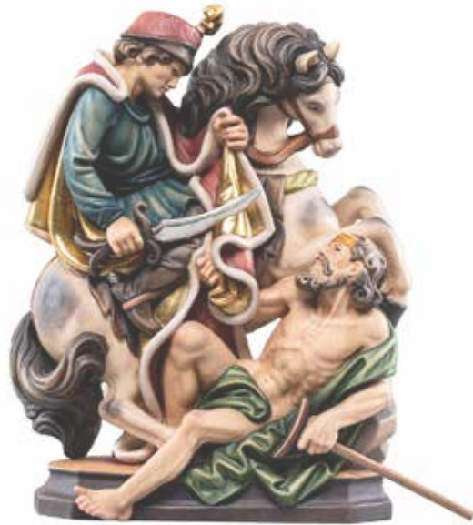
Bekende afbeelding van Sint Maarten

Toen hij eens op een feestdag naar zijn kerk ging, volgde hem een geheel naakte arme man. Martinus beval zijn aartsdiaken hem te kleden. Maar toen deze er zich niet mee haastte en eerst andere zaken ging regelen, gaf Martinus, in de sacristie gekomen, zijn eigen tuniek aan de arme, zond hem heen en bleef naakt achter.