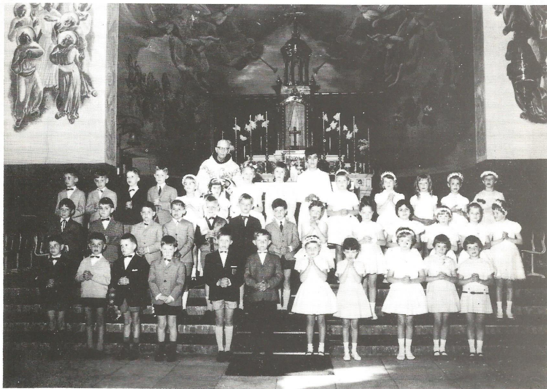
Eerste communicantjes in 1966.