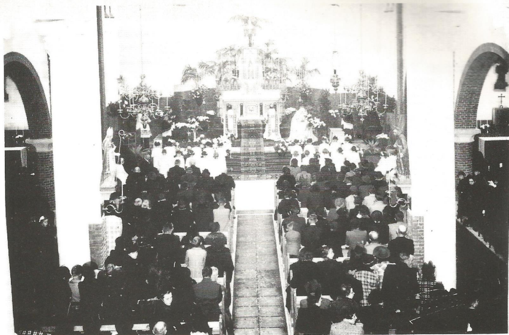
Opening van de verbouwde kerk op 10 november 1939.