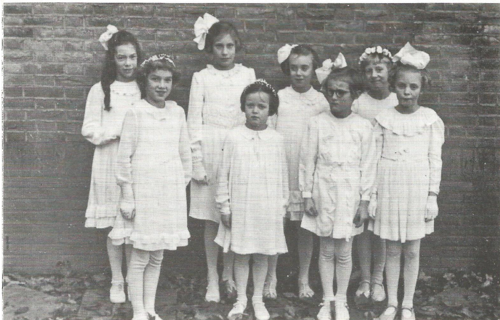
Een groepje "bruidjes" in 1942.