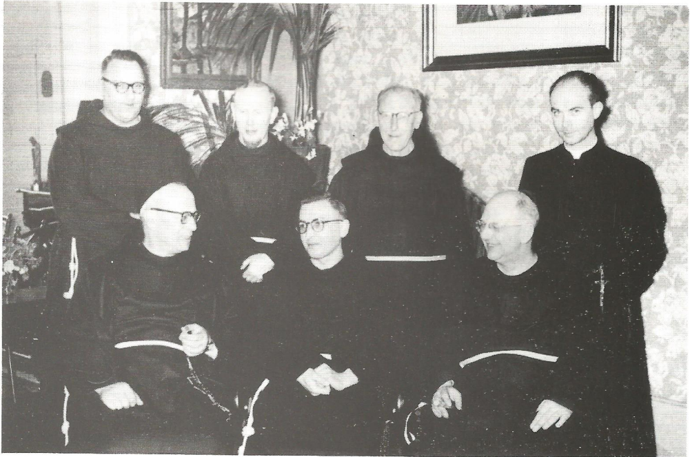
Een gezellige dag op de pastorie in 1955.