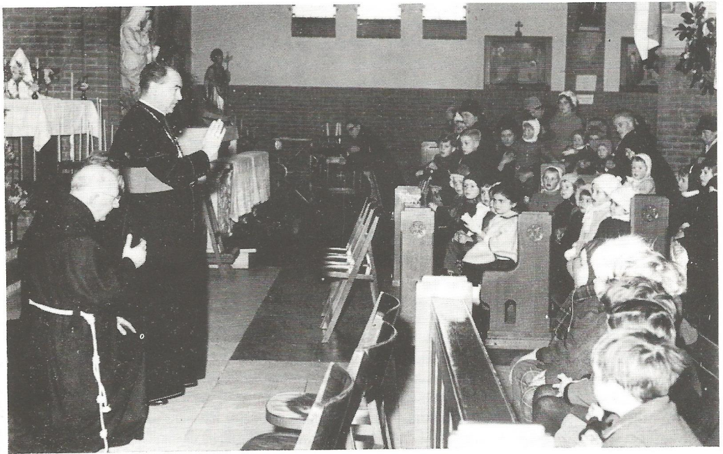
De eeuwfeesten 1962. Mgr. Bekkers praat met de kinderen in de kerk. .