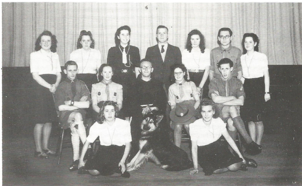
De eerste leiding van de jeugdbeweging.