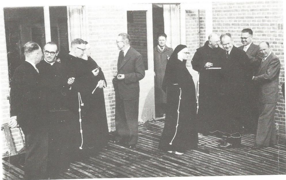
Opening R.K. Huishoudschool op 3 november 1953.