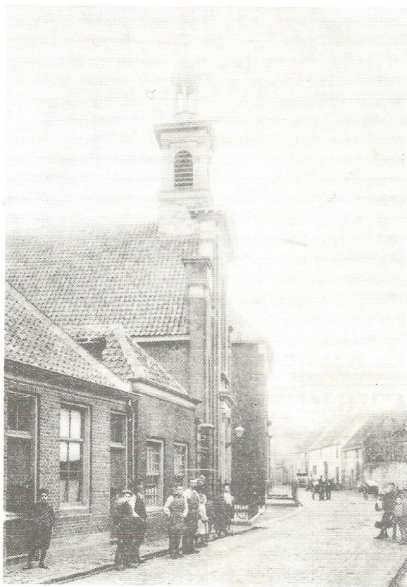
Onze kerk rond de eeuwwisseling.