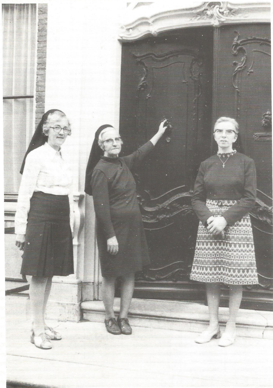
De zusters verlaten Zaltbommel in 1975.