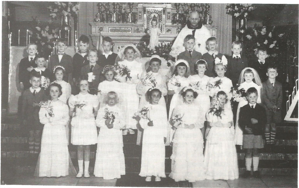
Eerste communicantjes in 1955.