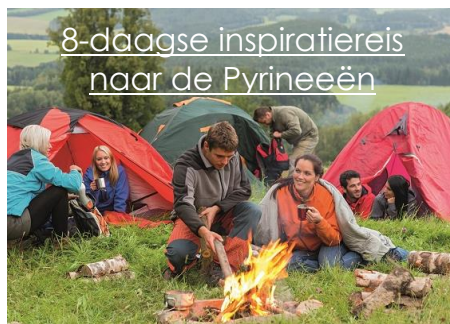
8-daagse inspiratiereis naar de Pyreneeën