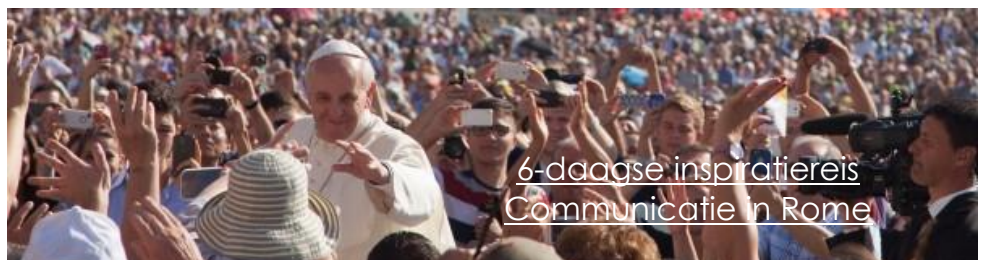
6-daagse inspiratiereis Communicatie in Rome