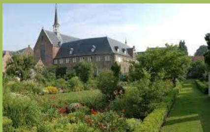
Franciscanenklooster te Megen