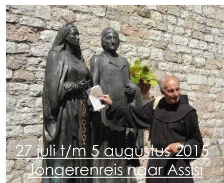
27 juli t/m 5 augustus 2015 Jongerenreis naar Assisi